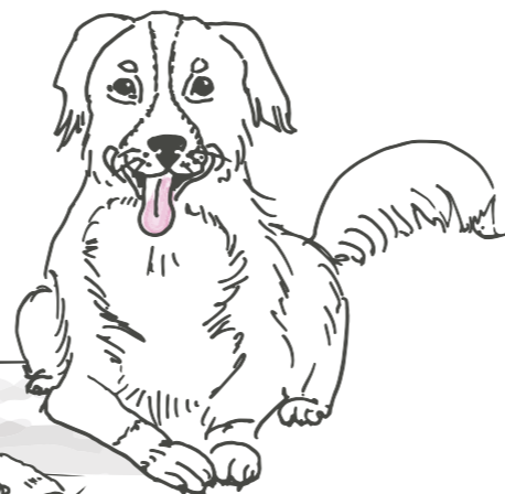
Bäri, unsere Hotelwächterin und bester Hund

Menu NICULIN'S SCHNITZEL feines paniertes Schnitzel* 16.50