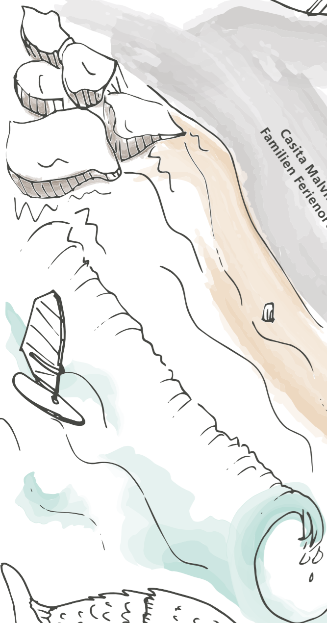
Casita Malvika Familien Ferienort