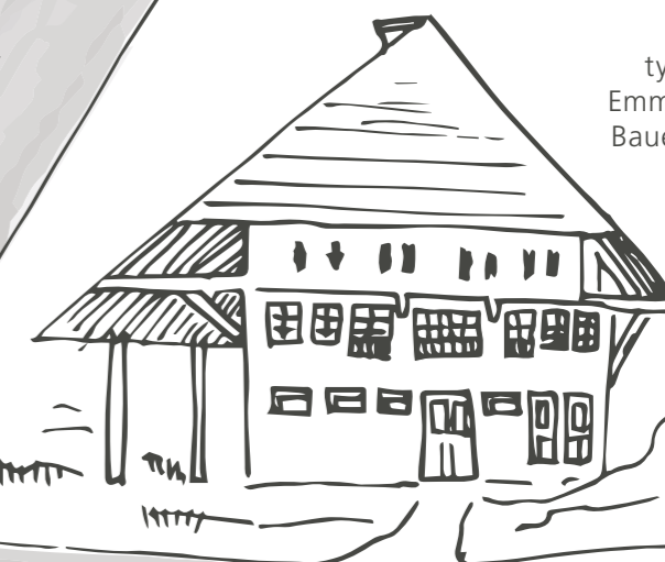
typisches Emmentaler Bauernhaus