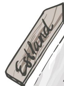
Heimat von Mama Malvika