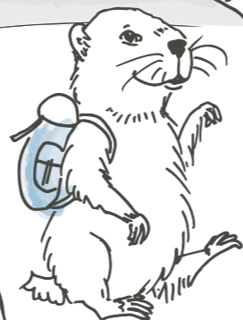
Niculin, das verschlafene Murmeltier