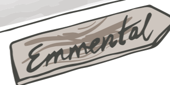
Heimat von Papa Daniel