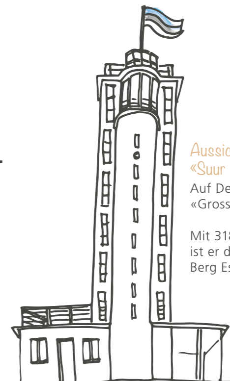
Aussichtsturm auf dem «Suur Munamägi» Auf Deutsch: «Grosser Eierberg»

FROZEN hausgemachte Glace (diverse Sorten) 4.90